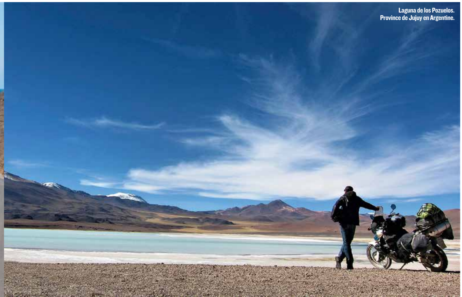
Laguna de los Pozuelos. Province de Jujuy en Argentine.