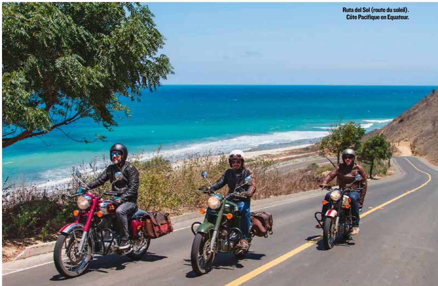
Ruta del Sol (route du soleil). Côte Pacifique en Equateur.