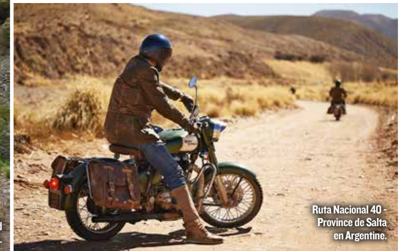
Ruta Nacional 40 - Province de Salta en Argentine.