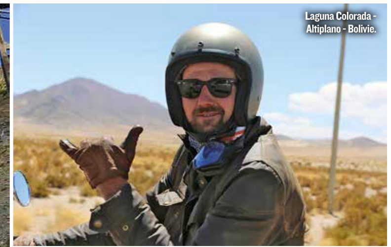
Laguna Colorada - Altiplano - Bolivie.