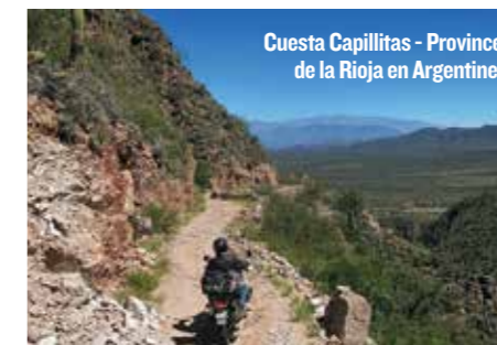
Cuesta Capillitas - Province de la Rioja en Argentine.

Le Brésil est en haut de ma liste. Les marais du Pantanal, le parc national des Lençóis Maranhenses, le parc national de la Chapada Diamantina et l'Amazonie nourrissent mes rêves de voyageur depuis toujours. Quand j'ai réalisé mon premier repérage sud-américain, le Brésil était initialement au programme mais après plus de 20000 km entre l'Argentine, la Bolivie, le Chili et le Pérou, j'ai dû me résoudre à y renoncer faute de temps. C'est